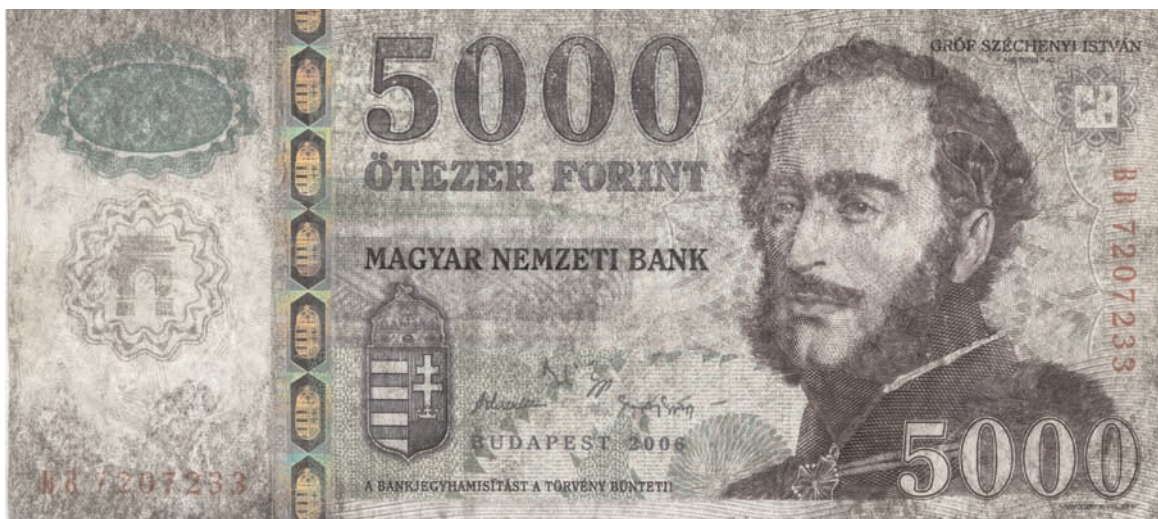
Kimosott, mosás hatására nagymértékben elszíneződött bankjegy

Ázott, rothadt, hiányos bankjegy, a bal oldali része visszahajtvva a rothadás miatt nem elválasztható