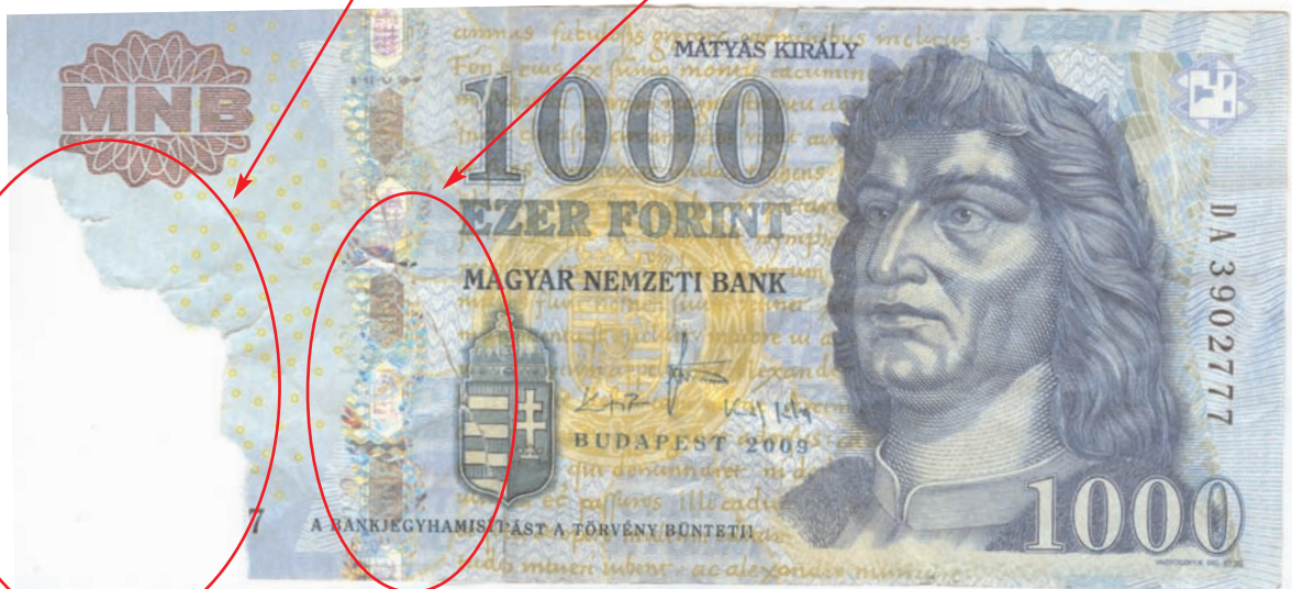
Felület- és sorszámhiányos, tépett, ragasztott bankjegy