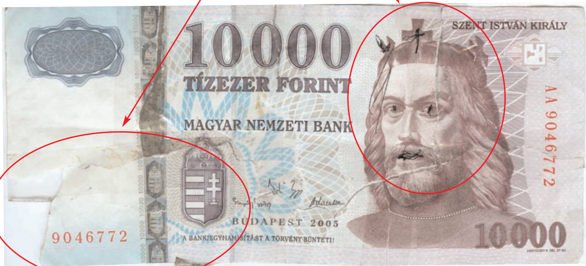
Tépett, ragasztott, felülethiányos, összefirkált bankjegy