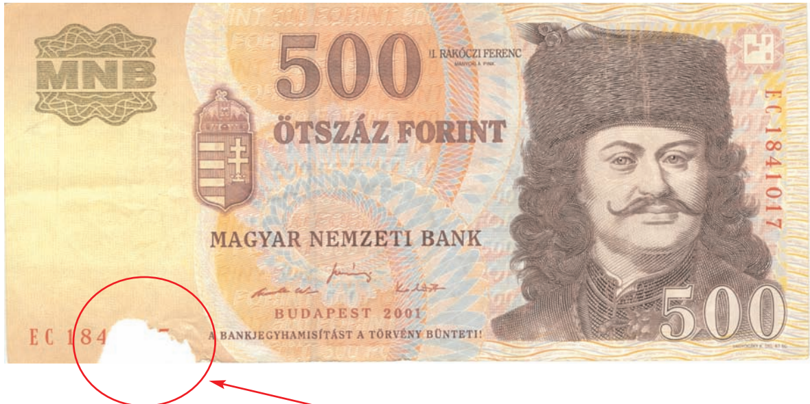
Kismértékű felülethiány a sorszámnál

Kimosott, a mosás hatására pirosra színeződött bankjegy