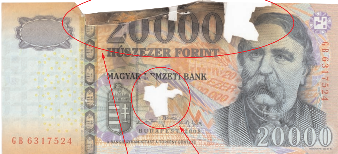
Égett, az égés hatására töredezett, hiányos bankjegy