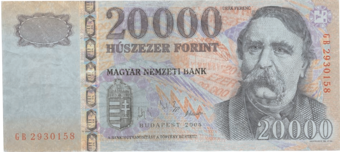
Kimosott, a mosás hatására kékre színeződött bankjegy