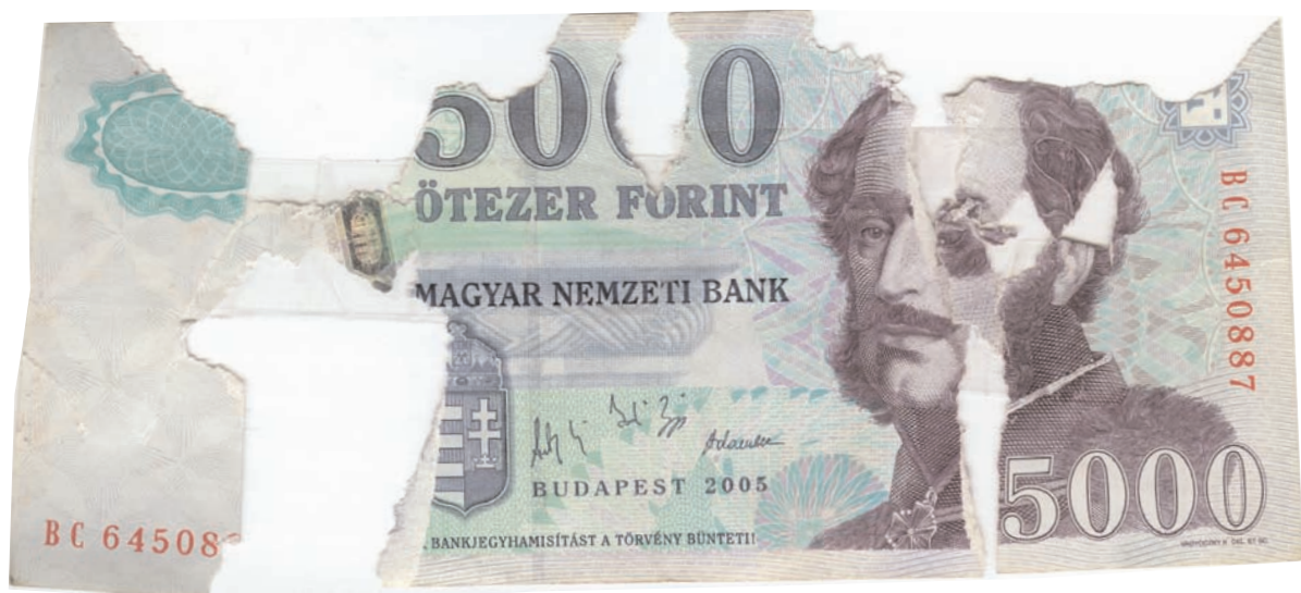
Több darabból álló, összeragasztott bankjegy, nagymértékű felülethiánnyal