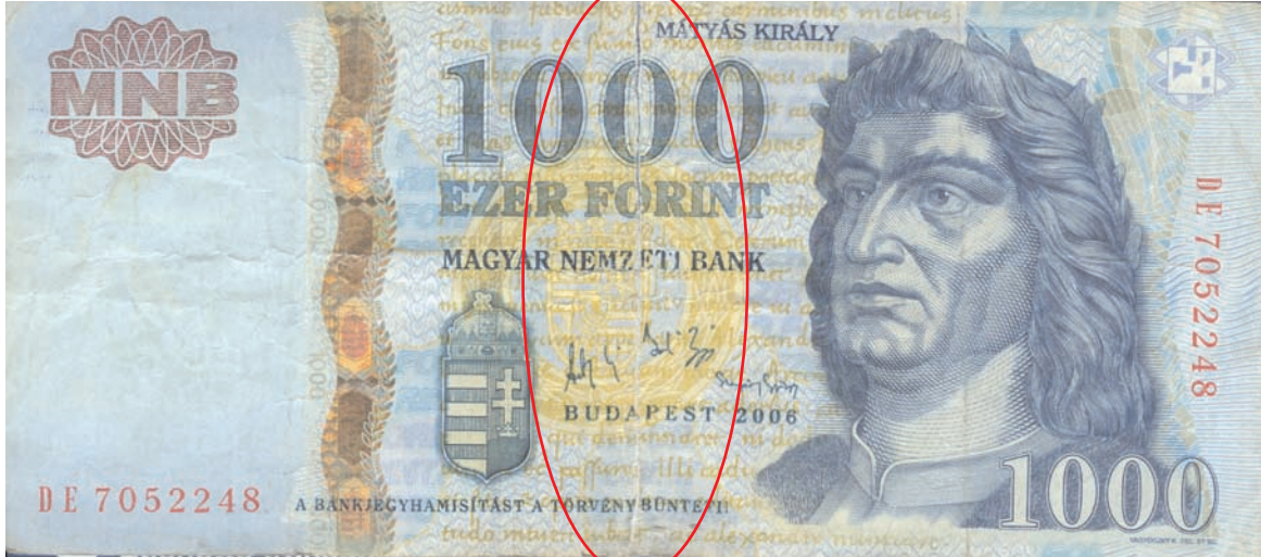
Szakadt, ragasztott bankjegy