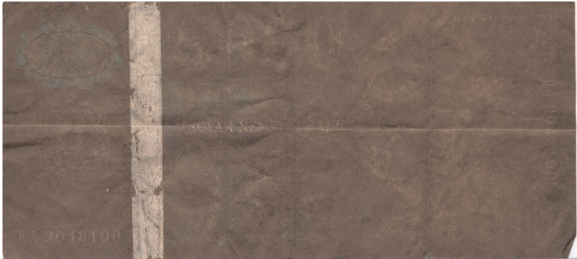
Kimosott, a mosás hatására teljesen elszíneződött 5000 forintos bankjegy