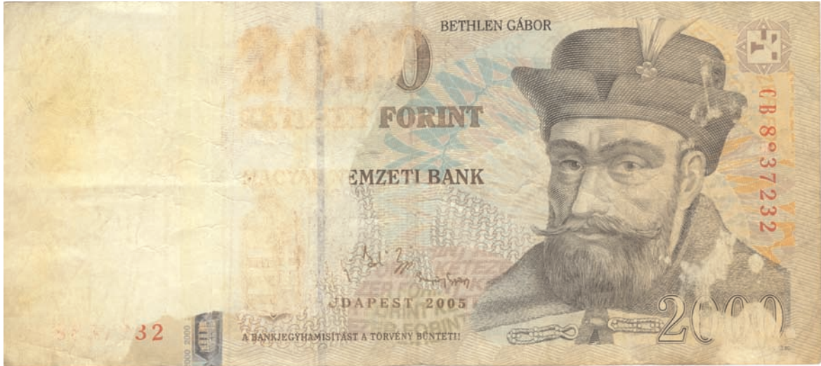
Vegyszerrel szennyezett, lekopott bankjegy