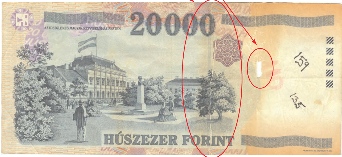
Tépett, ragasztott, lyukas bankjegy