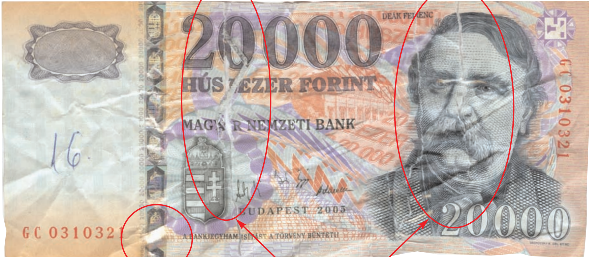
Több helyen tépett, ragasztott bankjegy