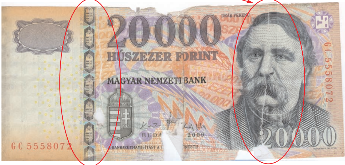
Tépett, több helyen ragasztott, felülethiányos bankjegy