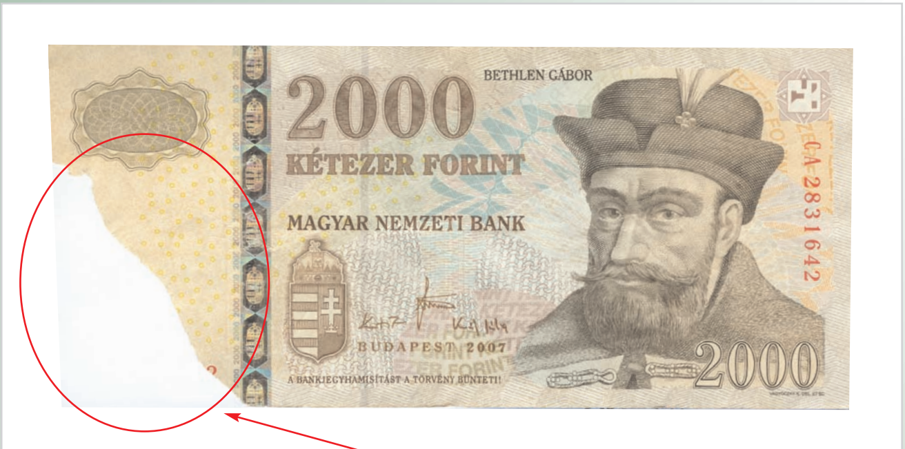
Tépett, felület- és sorszámhiányos bankjegy