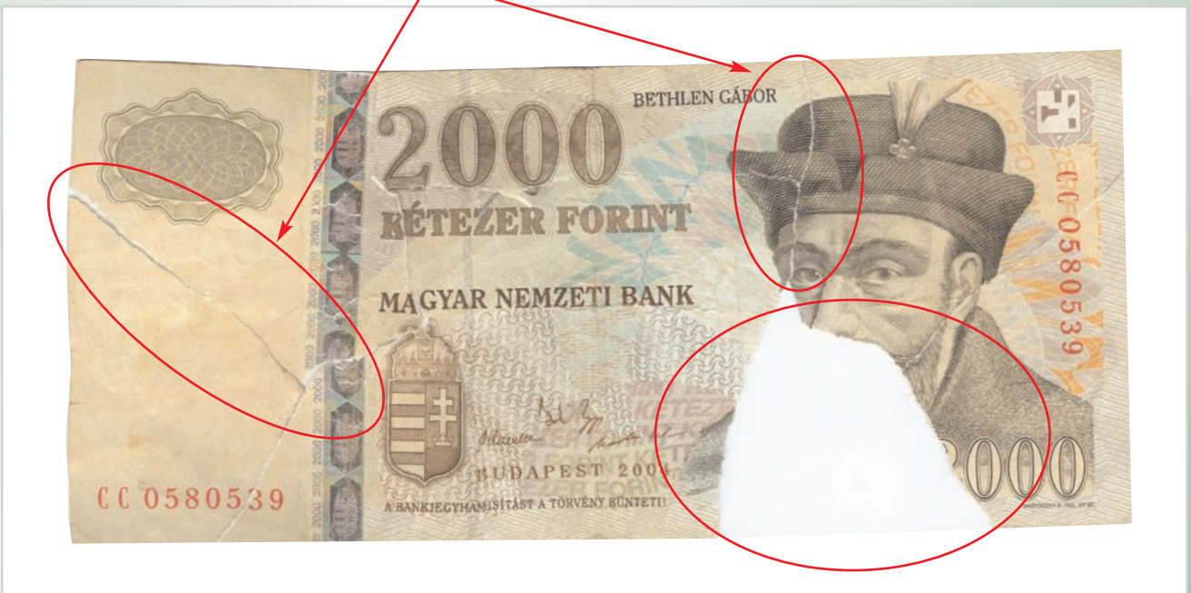
Több oldalon összeragasztott, felülethiányos bankjegy