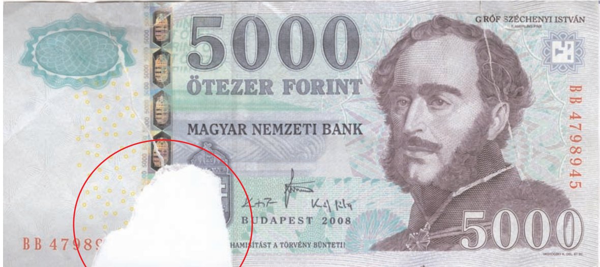
Felülethiány, részben hiányzó sorszám