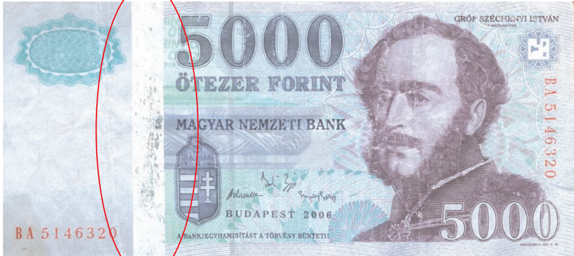
Kimosott bankjegy, lekopott hologram hatású fémcsík