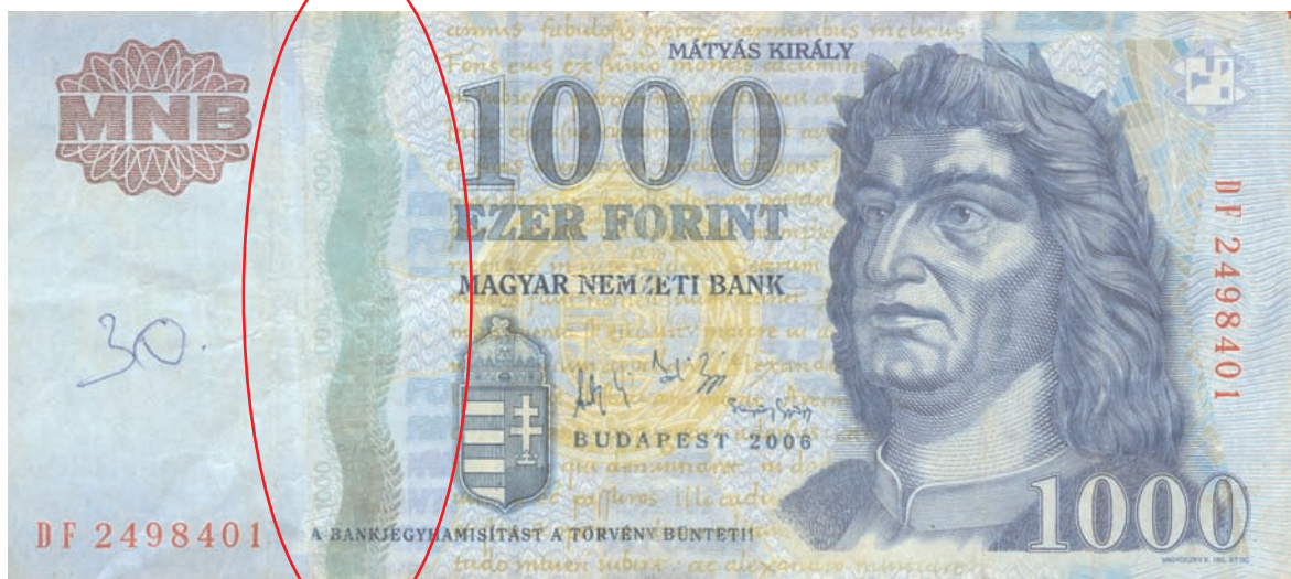
Elszíneződött, részben lekopott hologram hatású fémcsík