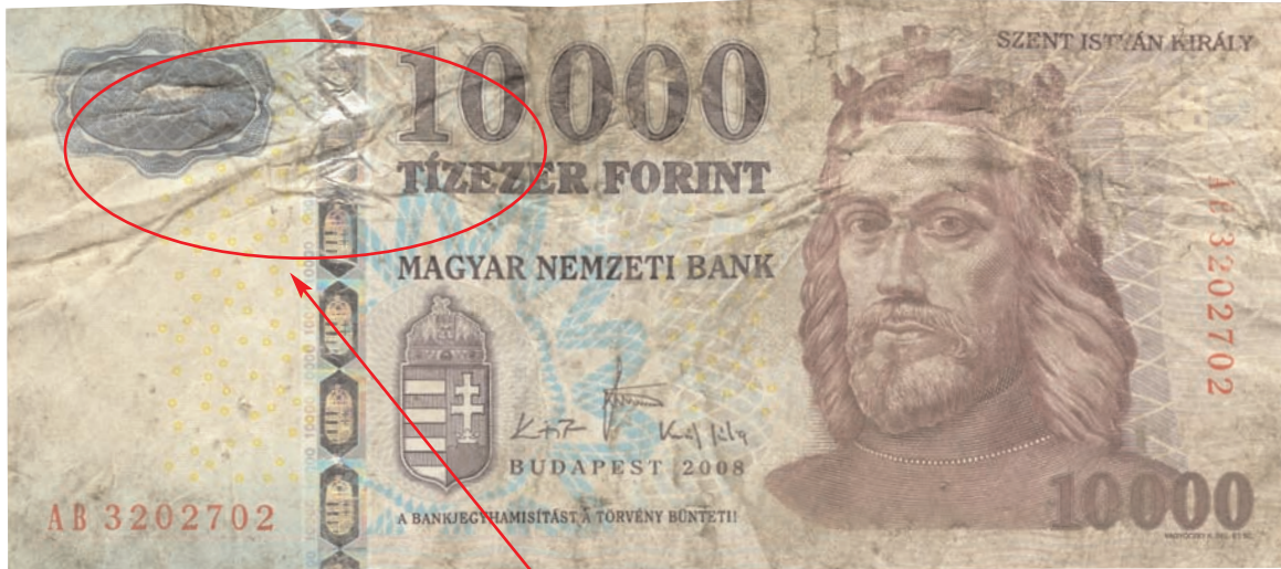
Erősen szennyezett, gyűrött, ragasztott bankjegy