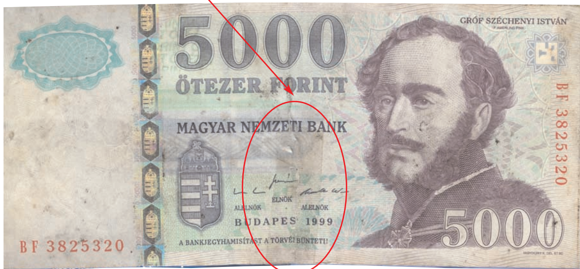
Ragasztott, teljes felületén szennyezett bankjegy