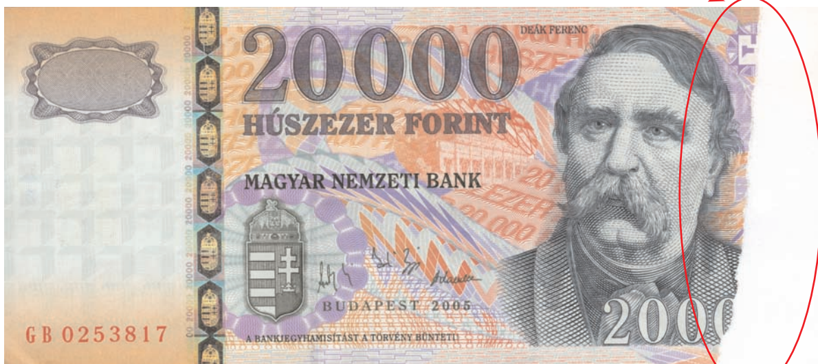
Felülethiány, hiányzó sorszám