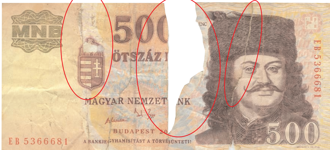
Tépett, közepén hiányos, ragasztott bankjegy